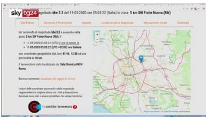
Sisma 3.3 scuote Roma, paura ma nessun...