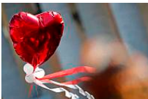
San Valentino: da Kuala Lumpur al Vaticano, cos' gli innamorati hanno festeggiato nel mondo