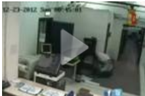
Tutti in galera gli 8 del colpo al caveau Sicurtecna di Guidonia