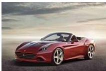
Ecco la Ferrari California T, debutta il V8 da 560 cavalli