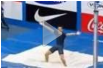
Salto con l'asta: il francese Renaud Lavillenie "cancella" il record dell'ucraino Sergey Bubka, salta 6,16 m