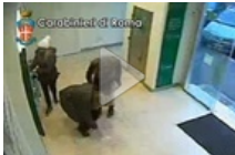
Roma: raggiravano anziani e rubavano bancomat, 5 arresti