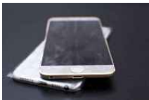
Le foto 'rubate' dell'iPhone 6