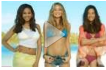
Le istruzioni di sicurezza sui voli Air New Zealand diventano sexy