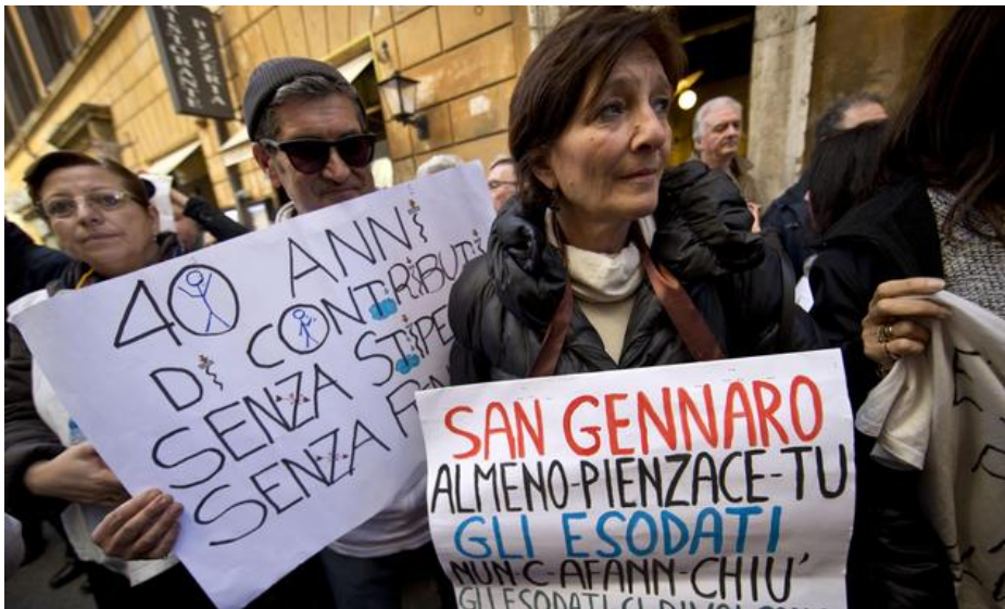
Credits: Protesta di esodati ieri a Roma (credits: Massimo Percossi/Ansa)

TAG: CRISI IMPRENDITORI IN CRISI IVA SUICIDI