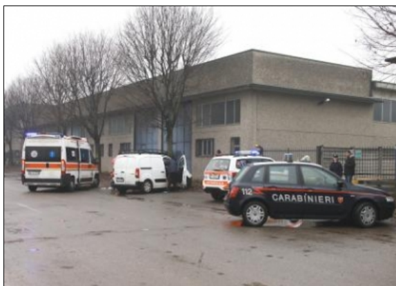
Un suicidio (immagine d'archivio)

Tra gli imprenditori il numero più alto dei suicidi. Tra i disoccupati il numero più alto dei tentati suicidi. L'analisi dei dati curata da Link Lab, il Laboratorio della ricerca socio-economica dell'Università Link Campus